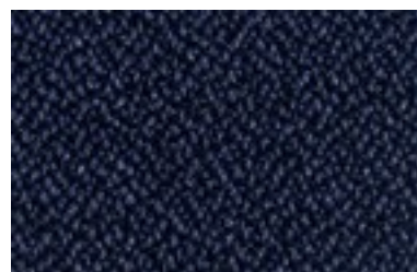
Bicolor Azul Noche 53