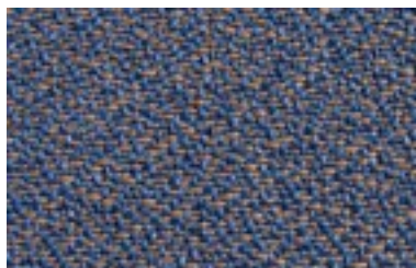
Bicolor Amarillo 52